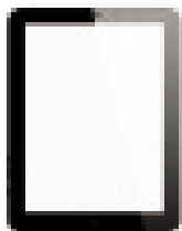
1 TABLETTE MINI